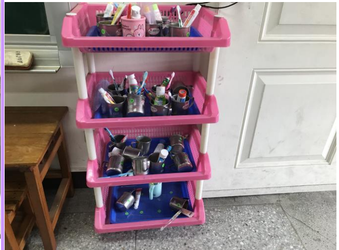
牙刷的家整齊擺放著同學的牙刷和牙杯