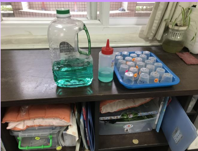
每天含氟漱口對牙齒多一層保護