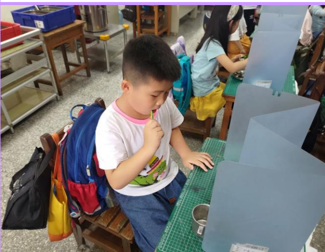
同學陸續餐後進行潔牙注重牙齒衛生