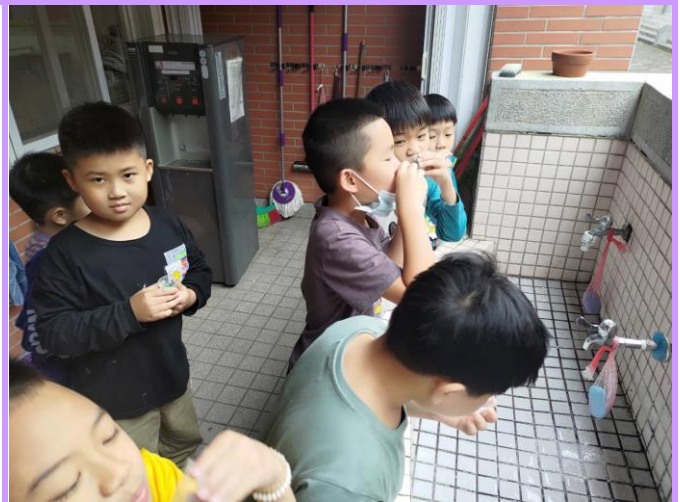
餐後用專屬小牙杯含氟在口中漱漱口