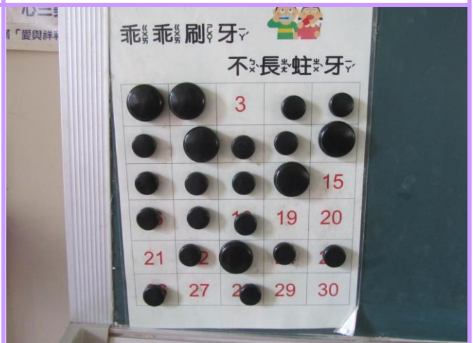
教室黑板設置潔牙完成登錄表格